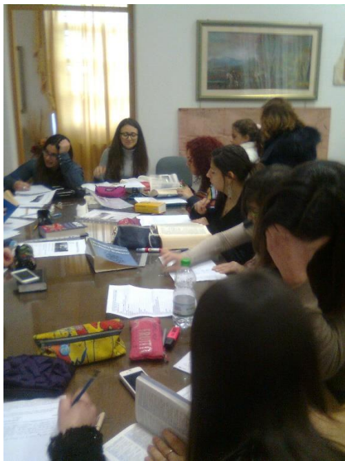
Gruppi classi 5 AL e 5BL al lavoro...nella Sala Conferenze