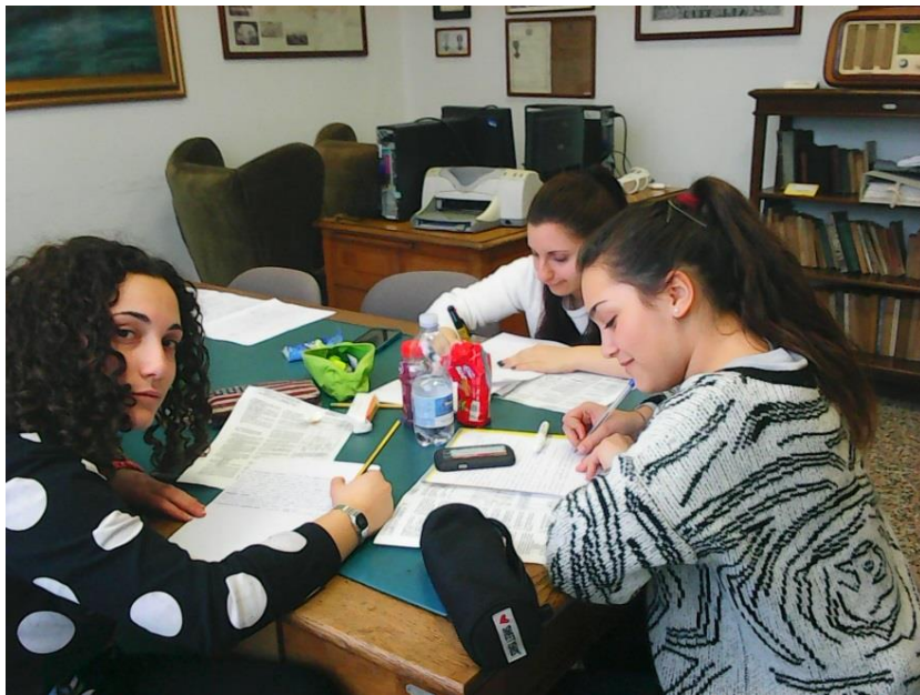
Gruppo classi 4 CU e 4 DU al lavoro in Biblioteca