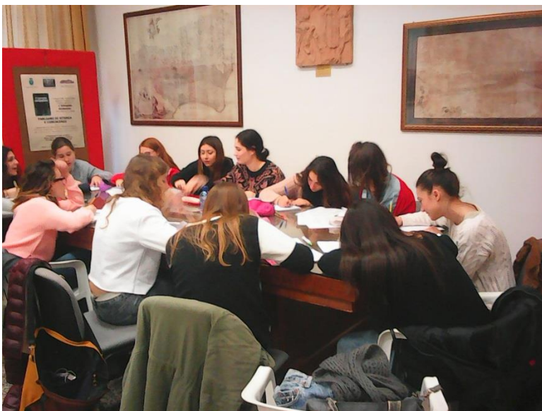
Gruppo classe 4 DU al lavoro... nella Sala Conferenze