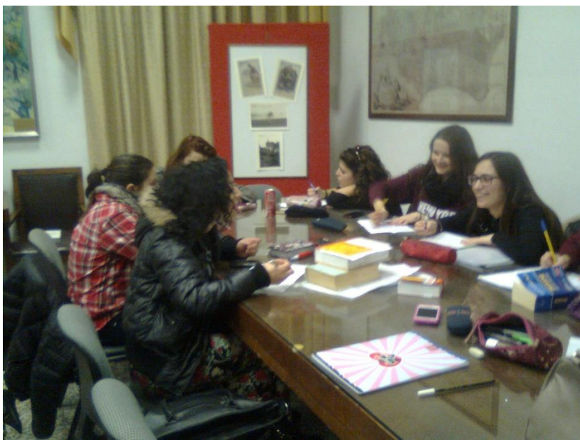
Gruppi 5 CL e 5 DL al lavoro di traduzione nella Sala Conferenze...